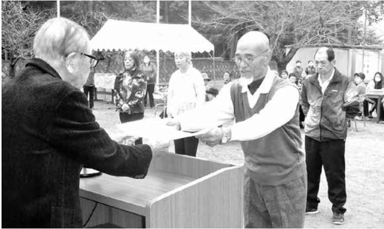
文化祭 功勞者表彰