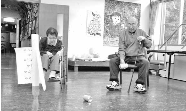
缶ころがしゲーム