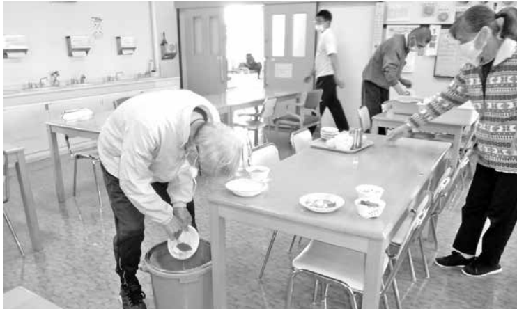
食 堂 そ う じ