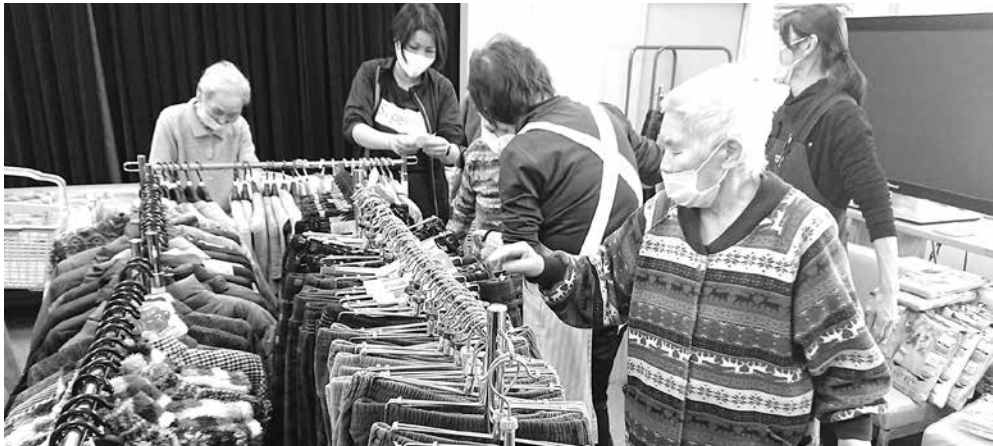
出張ショッピング