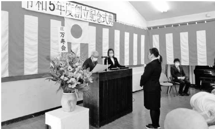
明翠苑創立記念式典