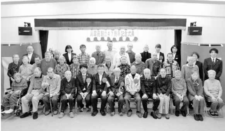
滴 翠 苑 創 立 47 周 年 記 念 式 典 に て