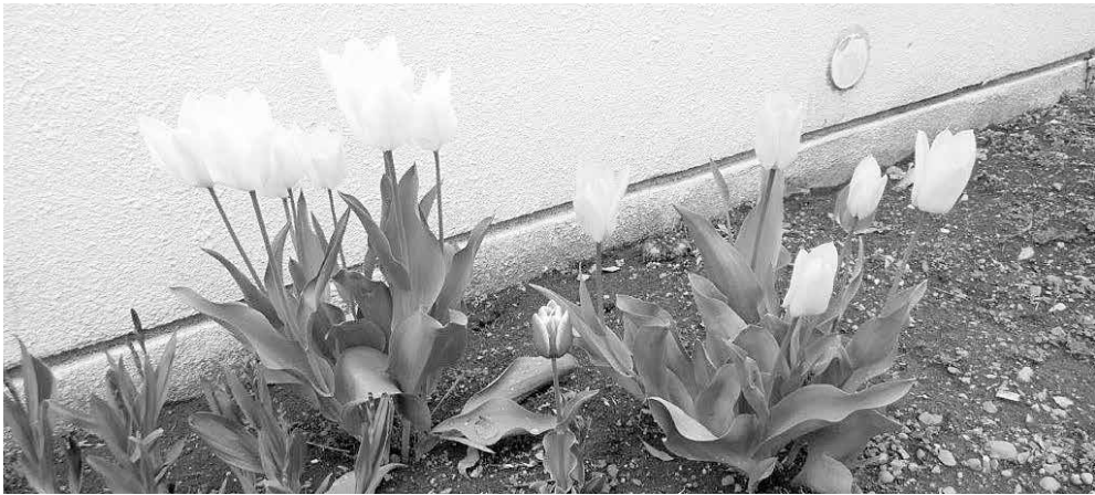
きれいなチューリップが咲きました