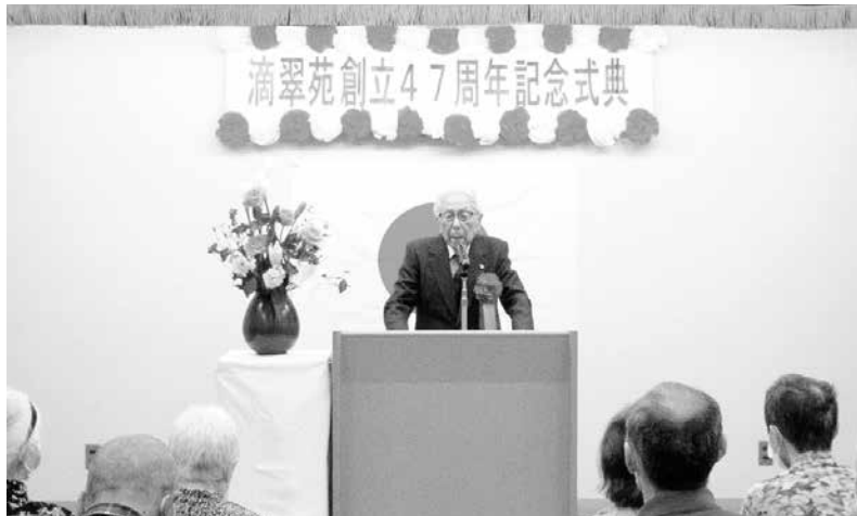
滴翠苑創立記念式典 会長挨拶