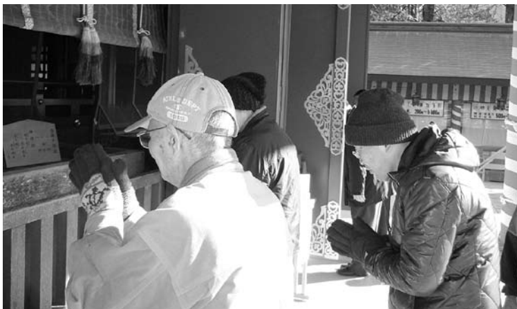
笠間稲荷神社へ初詣