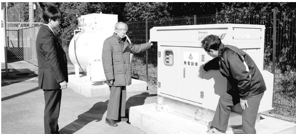
明翠苑のプロパンガス発電装置