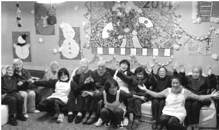
全 員 集 合