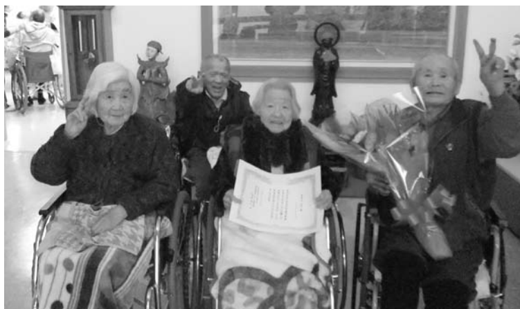
100歳 おめでとうございます (写真中央がご本人です)