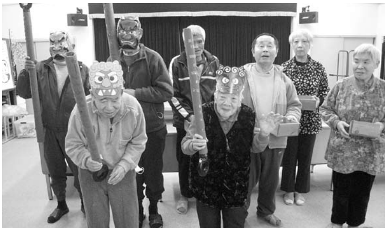
節 分 祭