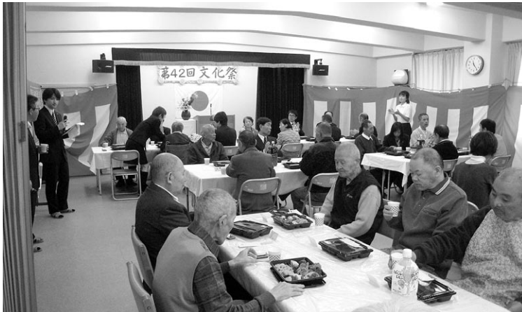
文 化 祭 祝 宴