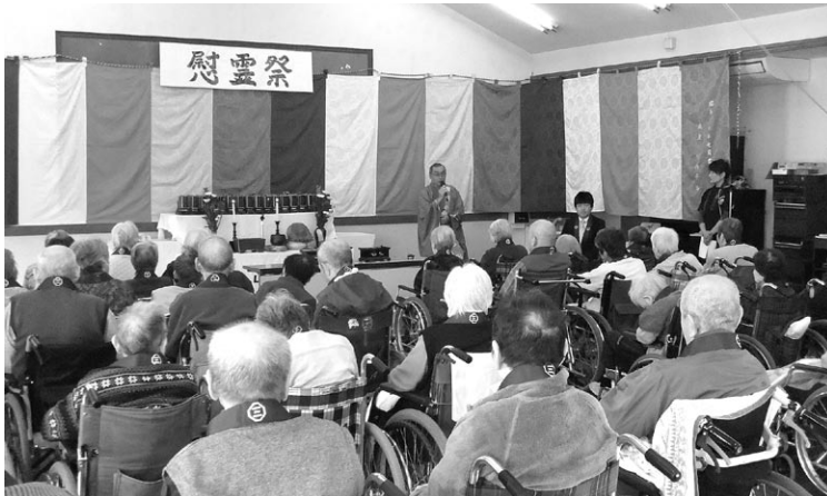
慰 霊 祭