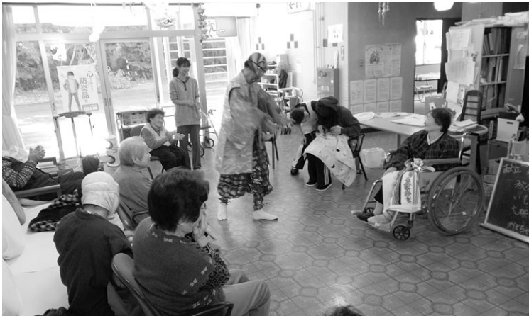
芋 煮 会