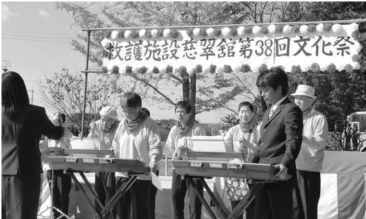
合奏クラブによる演奏