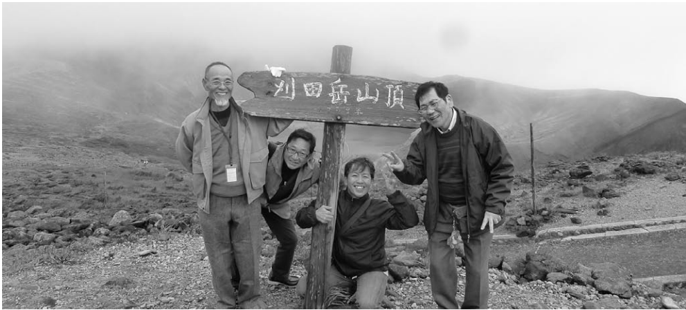
蔵 王 山 頂 に て