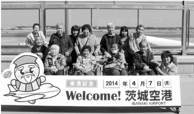
茨城空港ヘドライブ

●デイサービスセンター かすいかいかん 華翠会館だより 石岡市半の木一四八〇 TEL 〇二九九―三三―八二〇〇