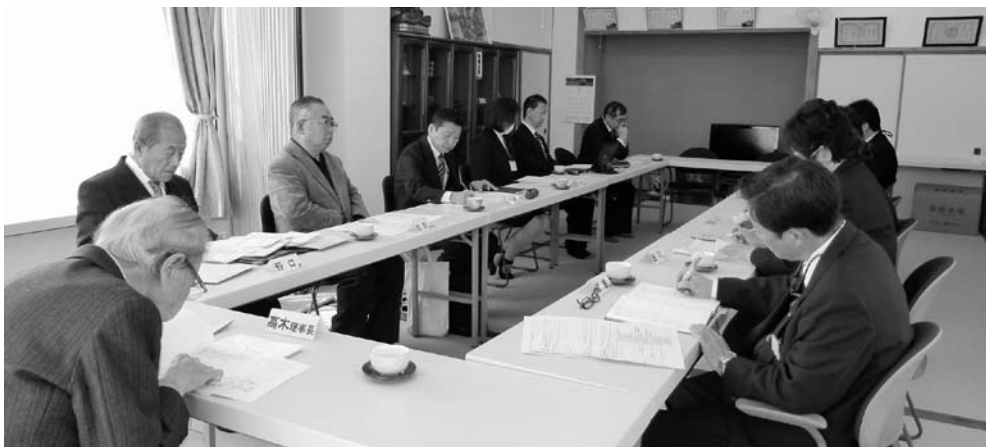
第 三 者 委 員 会